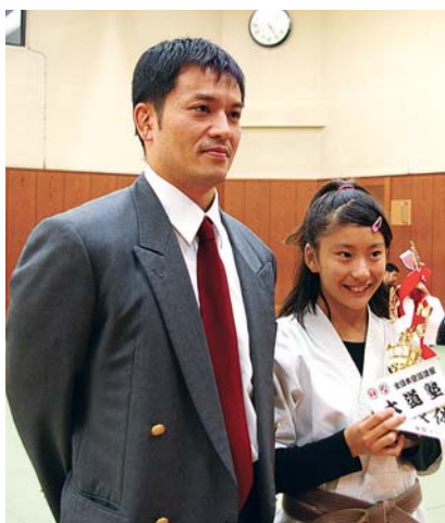
優勝記念に先生とツーショット撮影。