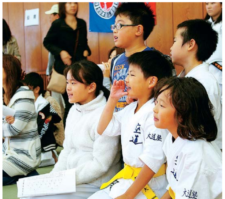
仲間の応援も力が入る!!大人から何も言われなくても まとまりある東支部の子どもたちでした。