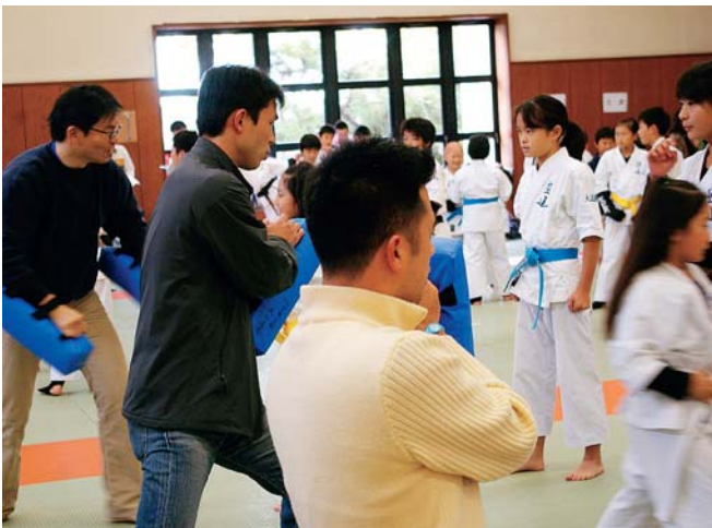
一般部のお父さんたちは、子どもたちアップのサポート。 朝からお疲れ様でした。