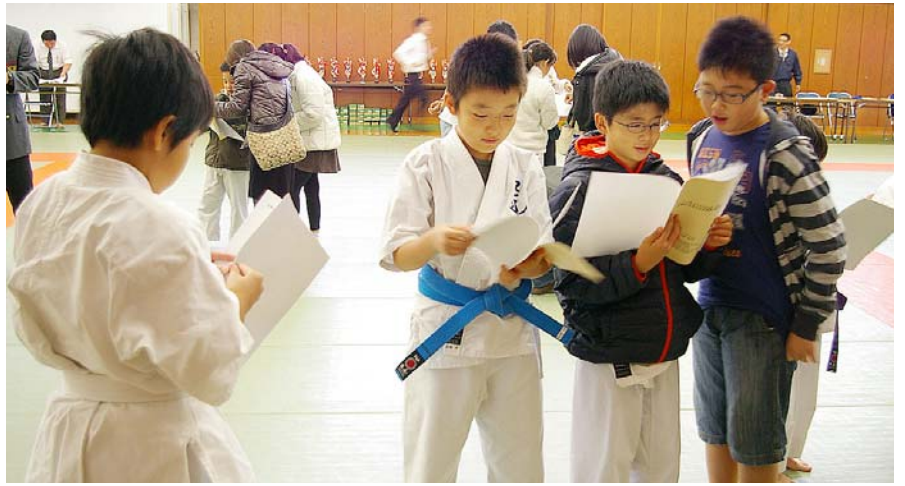
まず気になるのは対戦相手の帯の色かな。不安な時ですよ。