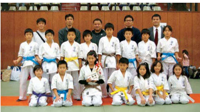
次もがんばろうね!! みんなお疲れ様!!