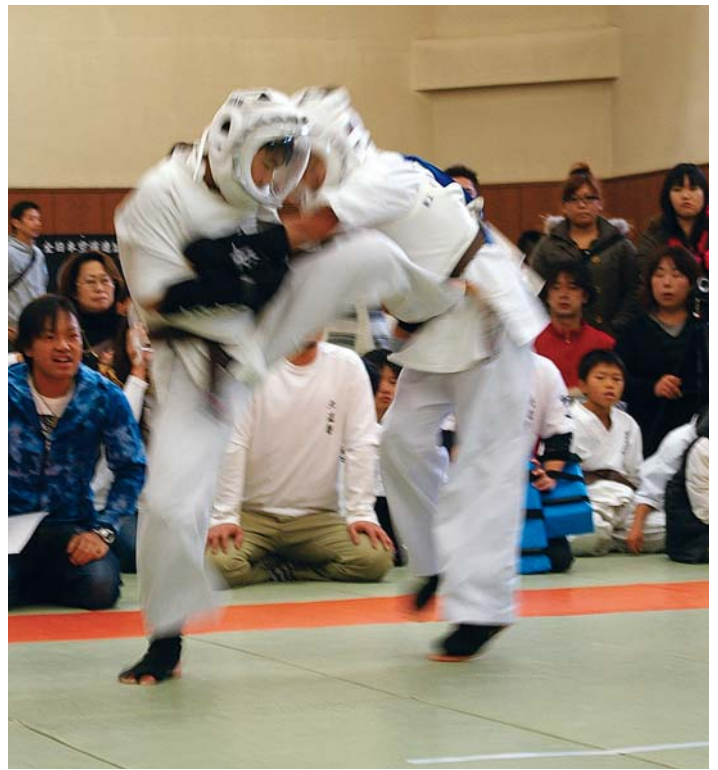
この蹴りのあと、投げ技に繋がりました。 子どもの試合とはいえ、緊迫感はかなりのもの!!